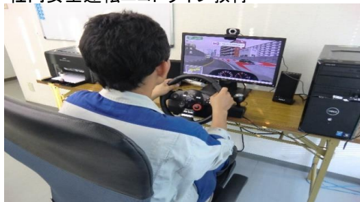
社内安全運転エコドライブ教育