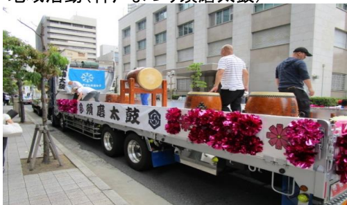
地域活動(神戸まつり須磨太鼓)