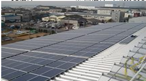
二見倉庫001 002 加西倉庫 太陽光発電