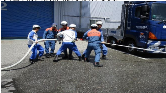
災害、防火訓練(放水訓練写真)