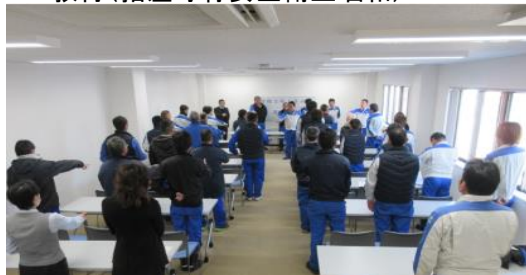
5S教育(指差呼称安全衛生唱和)